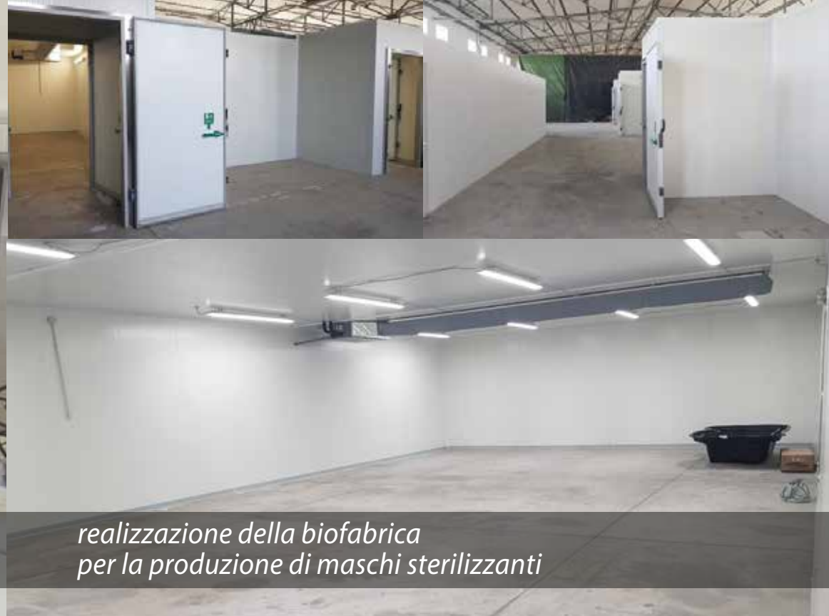
realizzazione della biofabbrica per la produzione di maschi sterilizzanti