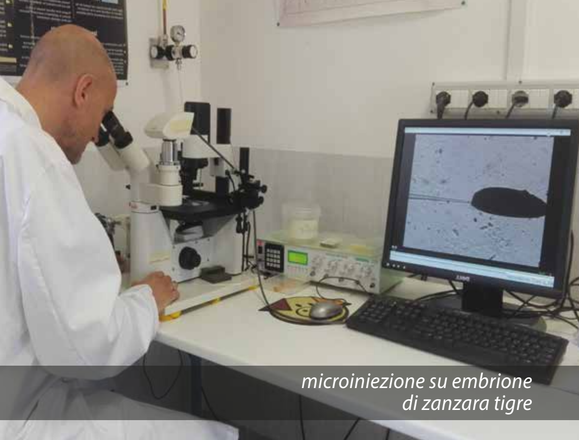
microiniezione su embrione di zanzara tigre